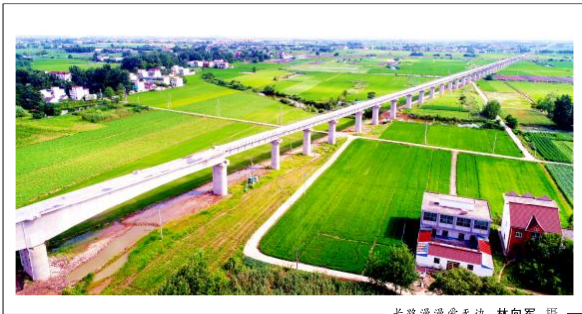
长路漫漫爱无边