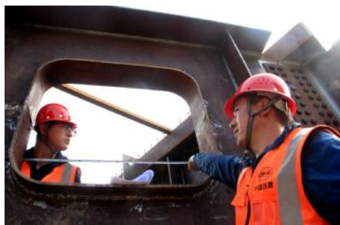
连日来,被誉为“兰州市北大门”的甘肃省重点工程,全长11.09公里的国道109线兰州段改扩建施工现场,百余名桥梁、路面突击队员顶烈日、战酷暑,全力推进工程进度。图为8月6日突击队员正在检测钢梁。