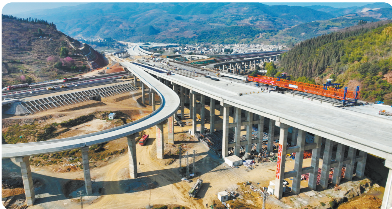
1月14日,五公司承建的三清高速公路王家村特大桥最后一跨T梁架设完成。该桥是三清高速公路先期通车段的控制性工程,左幅全长1621米,右幅全长1639米。施工中,项目建设者围绕目标任务精心组织施工、合理配置资源,扎实开展安全生产网格化、标准化管理,有效克服了地形复杂、施工难度大、安全风险高诸多困难,确保大桥建设优质高效推进。图为大桥施工现场。