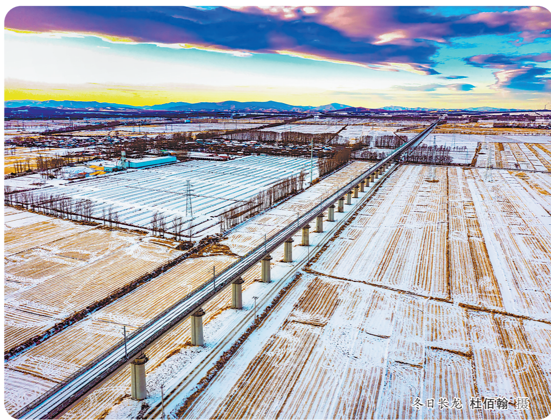
冬日荣龙