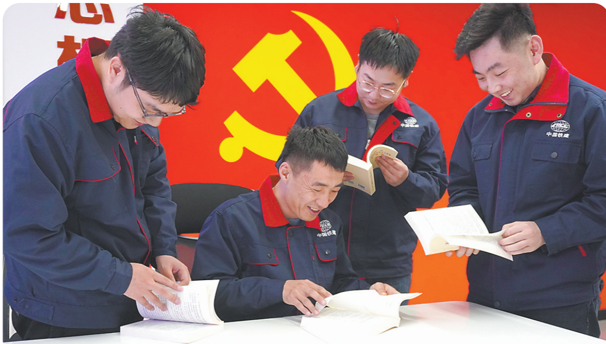
为持续深化主题教育，二公司雄商高铁项目党支部组织开展“党员自学2小时”活动，在党员活动室内，项目党员利用业余时间，自学《习近平新时代中国特色社会主义思想专题摘编》《习近平著作选读》等书籍，并进行交流讨论，切实提升政治理论水平。图为项目党员围绕学习内容进行交流研讨。

红旗招展，党旗飘扬，二公司包银高铁（内蒙段）项目建设团队用1年时间，以党建引领凝聚力，拧成一股绳。“为共产主义奋斗终身，随时准备为党和人民牺牲一切，永不叛党。”项目党员的铮铮誓言在乌海特大桥的上空不断回响。